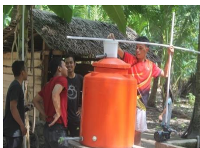
Gambar 3. Proses Perakitan Alat

Perakitan alat dilakukan secara bergotong-royong oleh masyarakat Massalima yang sebelumnya telah diberikan penyuluhan, dan juga dibantu oleh tim penyusun PROJEK HUMAS. Alat yang telah dibuat dipasang di salah satu sumur warga, sehingga air sumur yang merupakan hasil tampungan air hujan dapat difiltrasi terlebih dahulu sebelum digunakan oleh masyarakat Pulau Massalima.