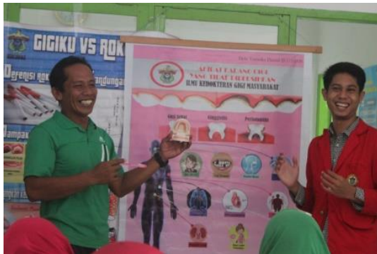
Sumber: Data primer yang diolah, 2017