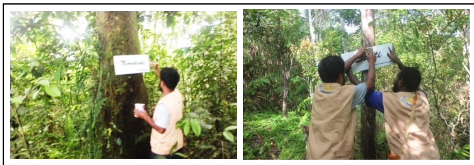
Gambar 2. Pemasangan Papan Zonasi Igya Ser Hanjob Pada Jalur Tracking.

zonasi yang di pasang yaitu Tumti, Bahamti, Nimahanti, dan Situmti. Masing-masing satu papan. Adanya kerjasama yang baik antara tim KKN bersama local guide , yaitu dengan memandu ketempat yang akan dipasang papan zonasi serta informasi mengenai tempat-tempat tersebut sehingga mempermudah pemasangan papan. Zonasi Igya Ser Hanjob merupakan teknik konservasi tradisional yang sudah diterapkan oleh masyarakat Arfak secara turun temurun (Gambar 2).