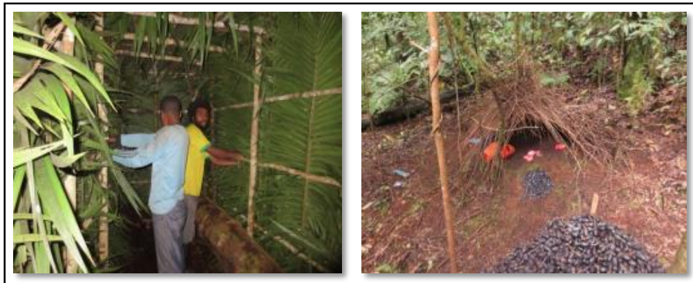
Gambar 6. Pondok Kamouflage dan Sarang Burung.