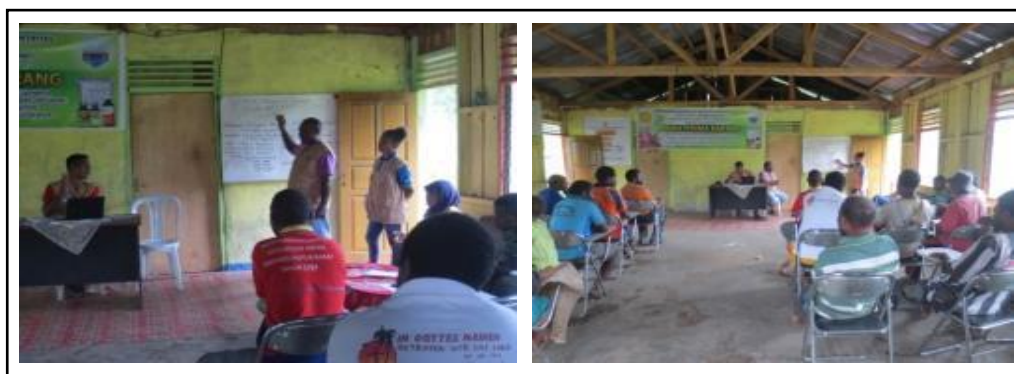
Gambar 5. Pembentukan Badan Pengurus Sanggar Seni Budaya

anggota sanggar tersebut sudah benar-benar siap untuk melakukan pertunjukan seni budaya, dan juga budaya mereka akan tetap terjaga sampai beberapa generasi berikutnya. Pada Gambar 5, telah menghasilkan suatu sanggar yang bernama "Sanggar Kwau Minmo". Keberhasilan program ini di dukung oleh penerimaan masyarakat yang baik melalui pemahaman tentang pentingnya pembentukan Sanggar ini.