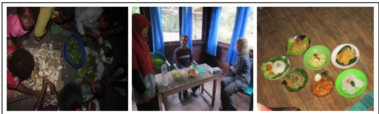
Gambar 4. Demonstrasi Penyiapan dan Penyajian Makanan Bersama Masyarakat (Kiri) dan Kepada Wisatawan di Home Stay (Tengah dan Kanan).

pengelola perlu ditingkatkan lagi, walaupun pada dasarnya masyarakat dikampung Kwau sudah sangat-sangat ramah dan bersahabat dalam hal itu. Namun beberapa contoh seperti penyediaan makanan yang masih ala kadarnya menjadi beberapa faktor alasan dari kegiatan tersebut, jika sudah ditingkatkan maka hal-hal kecil seperti akan mendatangkan profit yang tinggi pula. Program ini menghasilkan adanya pemahaman baru tentang cara pelayanan yang lebih baik kepada para wisatawan. Mulai dari menjaga kebersihan, keindahan, dan kenyamanan para wisatawan. Ketersediaan pengelola untuk mendengar pemaparan tentang hospitality homestay menjadi faktor pendukung yang sangat menunjang program ini. Namun, terdapat pula hambatan berupa banyaknya masyarakat yang kurang mengerti bahasa Indonesia. Namun, hambatan tersebut dapat diatasi dengan adanya penerjemah lokal.