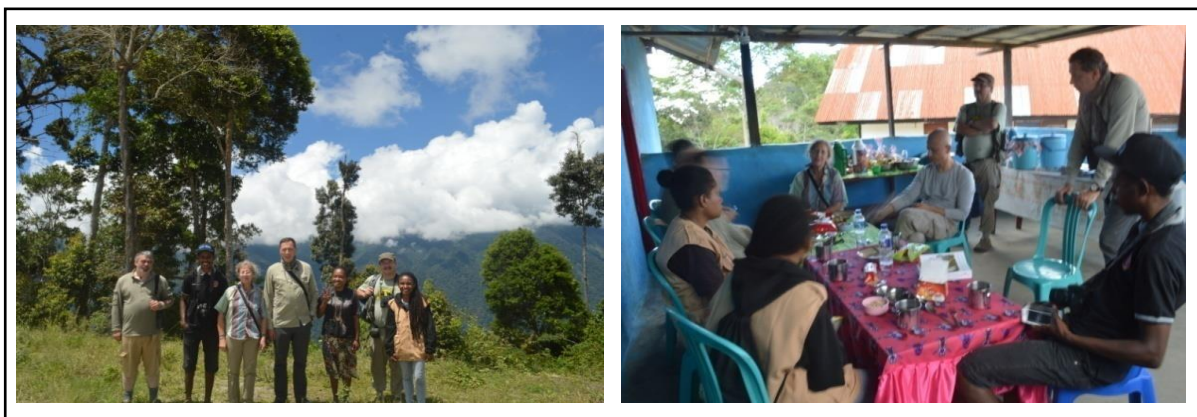
Gambar 7. Pendampingan Guiding pada Local Guide untuk Tim Tourist mancanegara yang Datang ke Lokasi Cagar Alam Pegunungan Arfak.

mendapat perhatian tersendiri. Belum adanya pelatihan guide membuat keterbatasan-keterbatasan tersebut belum dapat di atasi. Dengan adanya program kerja Guiding ini, diharapkan dapat mengurangi sedikit keterbatasan tersebut. Bentuk dari program ini adalah memberikan contoh pengarahan yang lebih baik kepada Local guide agar proses Guiding berjalan lebih efektif dan edukatif (Gambar 7).