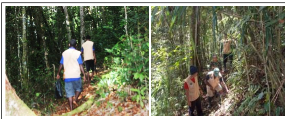
Gambar 1. Orientasi Jalur Tracking (kiri) dan Pemasangan Patok Jarak (kanan).

yang tidak menentu menjadi salah satu faktor penghambat karena menyebabkan medan menjadi licin sehingga sulit untuk dilalui. Orientasi jalur tracking birdwatching berada pada hutan alam sehingga sangat penting untuk dilakukan dengan tujuan agar kita mengetahui medan yang akan dilakukan pemasangan patok jalur tracking . Sebelumnya jalur-jalur tersebut telah di buat oleh local guide beserta masyarakat setempat sehingga mempermudah untuk menyusuri jalur-jalur tersebut.