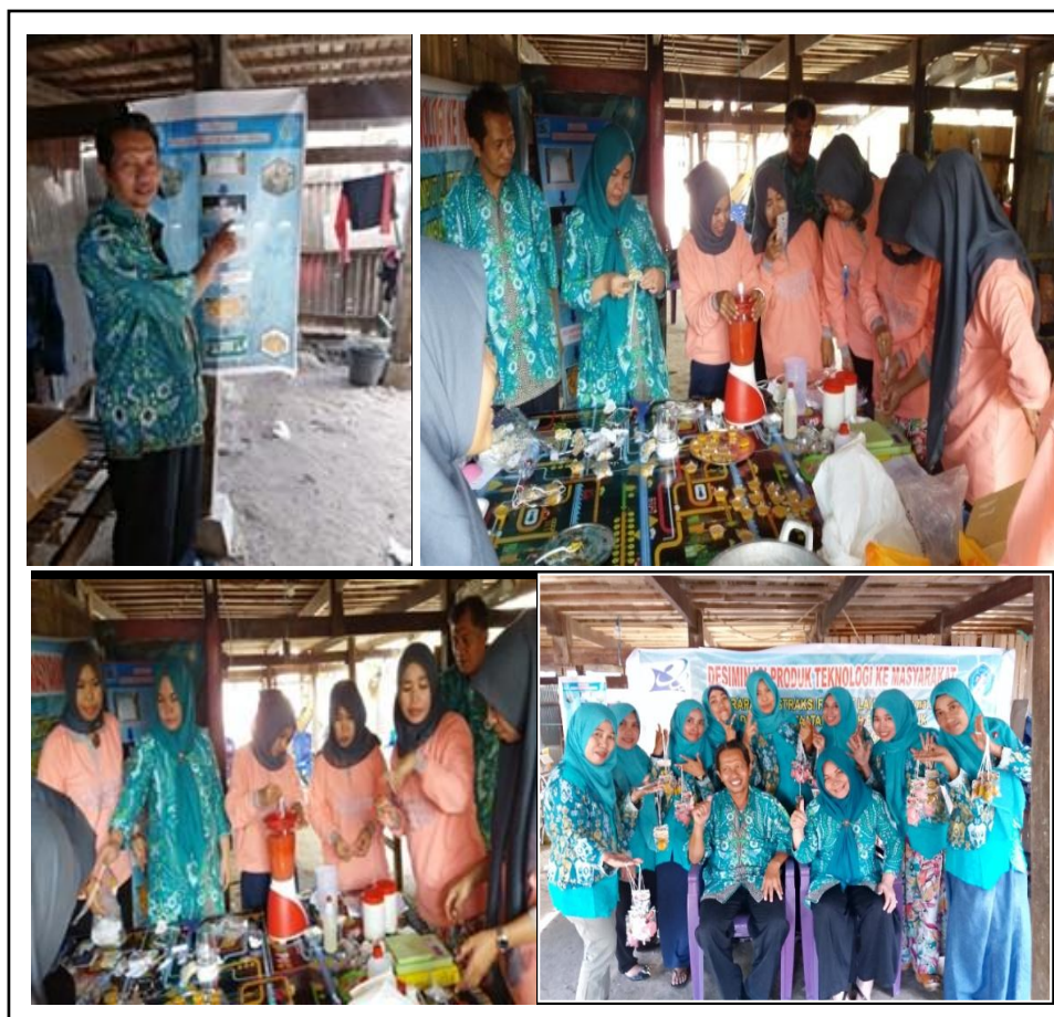
Gambar 4. Diseminasi Teknologi Pengharum Ruangan Rumput Laut di Kabupaten Jeneponto

Diseminasi produk teknologi ke masyarakat dengan penerapan ekstraksi rumput Laut ( Eucheuma cottonii ) dan pemanfaatan limbah padat untuk pembuatan pengharum ruangan minimalis di Kabupaten Jeneponto berfungsi untuk membekali ilmu pengetahuan masyarakat sehingga dapat mengolah rumput laut. Dimana jika dilakukan secara rutin akan terbentuk industri kreatif yang mengembangkan usaha rumput laut. Harapan kedepannya dapat dimanfaatkan dalam aktivitas ekonomi daerah dalam upaya peningkatan produk unggulan dan daya saing.