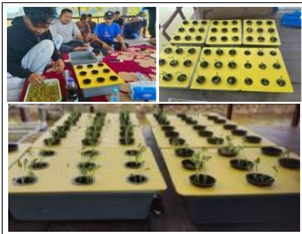
Gambar 6. Pemindahan bibit dan pertumbuhan tanaman pada instalasi hidroponik sumbu.