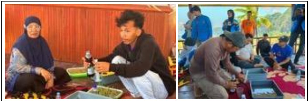
Gambar 5. Penyiapan larutan nutrisi AB mix.