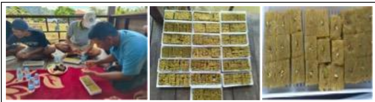
Gambar 4. Penanaman benih pada media rockwool.

Proses pemindahan bibit sayuran yang telah tumbuh ke baskom yang telah diisi dengan larutan nutrisi A dan B (Gambar 6). Kapasitas baskom yang digunakan adalah 5 liter. Peserta memasang sumbu pada net pot. Benih yang telah tumbuh dimasukkan ke dalam net pot. Pemeliharaan dilakukan oleh anggota KTH Lamperangan secara bergantian untuk mengecek larutan nutrisi pada instalasi, jika larutan nutrisi kurang maka dilakukan penambahan nutrisi untuk menjamin ketersediaan unsur hara bagi tanaman.