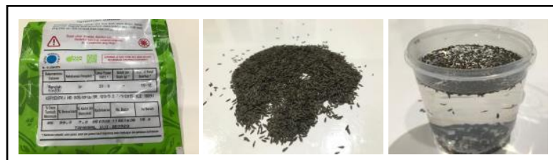
Gambar 3. Penyiapan benih sebelum disemai.

Nutrisi hidroponik yang digunakan berbentuk serbuk. Nutrisi dilarutkan dalam air untuk mendapatkan pekatan A dan B yang akan digunakan sebagai nutrisi untuk pertumbuhan sayuran hidroponik. Untuk pertumbuhan awal sayuran hidroponik digunakan 5 ml pekatan A dan 5 ml pekatan B untuk satu liter larutan nutrisi.