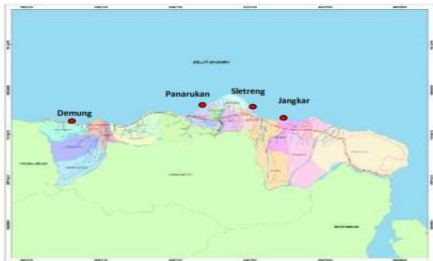
Gambar 1. Lokasi Pengambilan Sampel [8].

Pengambilan sampel dilakukan selama satu tahun yaitu pada bulan Desember 2021 sampai dengan November 2022. Di tambak udang Vannamei yang ada di Situbondo dengan 4 lokasi yang berbeda yaitu Demung, Panarukan, Jangkar dan Sletreng.