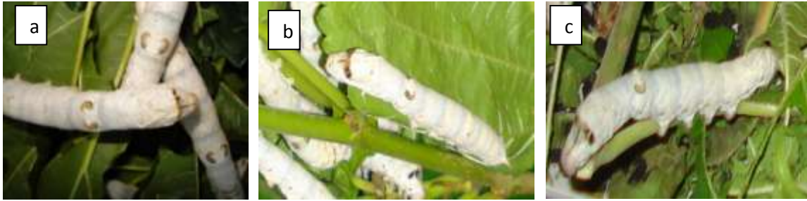
Figure 1. Pattern of larval P1 (a), P2 (b) and P3 (c)

Tanda yang khas di tubuh ulat tersebut merupakan tanda atau ciri dari ras ulat Jepang. Menurut Sampe, dkk. (1989) bahwa persilangan antara ulat polos dengan bintik akan menghasilkan corak tubuh ulat yang bintik karena alel (*p) lebih dominan dari polos (p). Tazima (1978), menjelaskan bahwa warna dan corak larva ulatsutera ditentukan oleh selain faktor genetik juga karena distribusi pigmennya dalam sel hypodermal dan epikutikula.