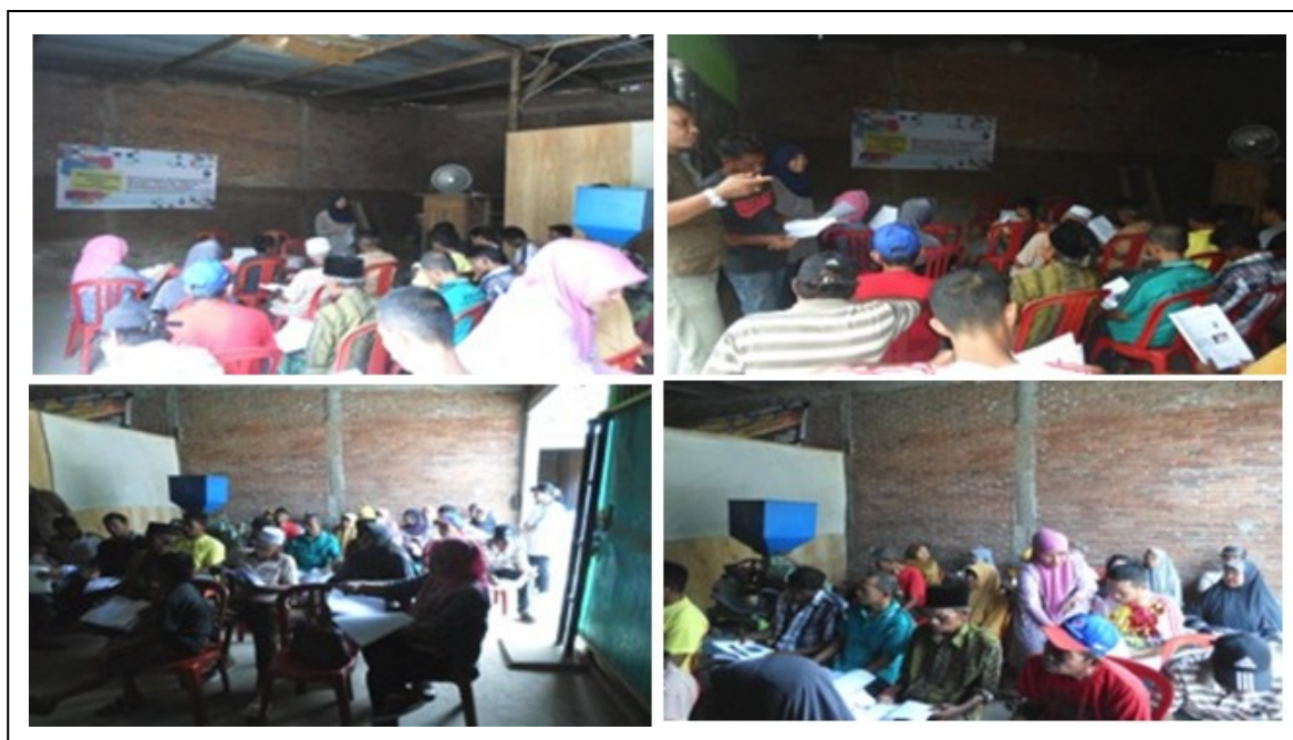
Gambar 2. Ceramah dan diskusi

Tahapan-tahapan kegiatan di atas merupakan tahapan kegiatan yang perlu dilakukan agar beras yang dikemas vakum merupakan beras yang bermutu baik sesuai dengan Standar Nasional Indonesia (SNI), dimana derajat sosoh, persentase beras kepala, beras patah dan beras menir merupakan beberapa syarat beras digolongkan bermutu baik.