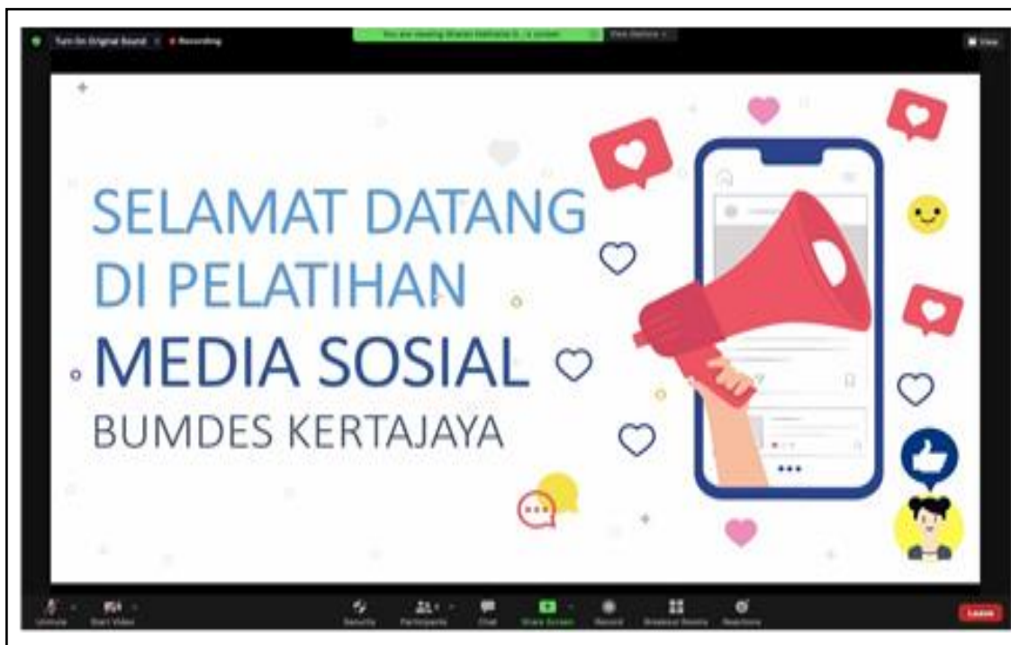
Gambar 1. Pelatihan Media Sosial Tahap 1.

Instagram juga mengeluarkan aplikasi khusus bagi UMKM untuk mempromosikan dan menjual produknya dengan menggunakan Instagram bisnis. Tujuan tim memperkenalkan Instagram bisnis adalah membantu BUMDes untuk mempromosikan produk unggulan yang simplicity dengan cakupan yang lebih luas dan tidak hanya sebatas di daerah BUMDes itu berada (Gambar 1).