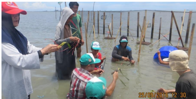
Gambar 2. Bersama mitra (Kelompok nelayan desa Pundata Baji) melakukan transplantasi dengan metode jangkar single shoot

Transplantasi dengan metode ini dapat dikatakan metode yang sangat praktis, dimana pengambilan material lamun (transplant) dilakukan dengan tangan (ataupun sekop). Material lamun yang ditransplantasikan diikat kepada jangkar besi (agar transplant tidak terbawa arus) lalu jangkar besi tersebut ditancap masuk bersamaan dengan lamun transplantnya hingga kedalaman 3-5 cm (Gambar 2). Jumlah tegakan yang ditransplant dengan metode ini adalah sebanyak 24 tegakan dengan jarak antara satu tegakan dengan lainnya adalah kurang lebih 30cm (4 x 6 tegakan) dan secara keseluruhan membentuk segi empat (sekitar 150cm x 100cm). Sama halnya pada metode frame , semua daun transplant digunting hingga menyisakan kurang lebih 20cm panjang daun, sehingga memudahkan dalam hal monitoring nantinya.