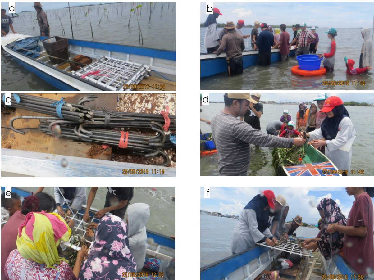
Gambar 5. Persiapan alat, bahan dan pelaksanaan aktivitas kegiatan pelatihan transplantasi lamun dan pembuatan demplot, a) Alat dan bahan demplot (frame bambu, kurungan dan patok besi-jangkar); b) Persiapan pembuatan demplot; c) Patok besi-jangkar yang digunakan untuk transplantasi metode jangkar; d) Memberi contoh pemotongan lamun; e-f) mengikat lamun pada frame bambu;

Kegiatan percontohan transplantasi lamun dilaksanakan di perairan pantai Pundata Baji pada tanggal 25 September 2016 yang dihadiri oleh 20 orang dari kelompok sasaran. Pada kegiatan percontohan tersebut, dikenalkan tiga metode transplantasi yang sederhana dan ramah lingkungan, yaitu metode frame, single shoot dan kurungan. Kegiatan selama pembuatan demplot transplantasi lamun (Gambar 5a -5f).