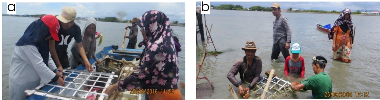
Gambar 1. Aktivitas Penanaman lamun, a) Kelompok nelayan sedang dilatih cara mengikat tumbuhan lamun pada titik pertemuan kisi frame bambu; b) Pengikatan batu bata (sebagai pemberat) pada frame bambu yang telah diikat tegakan lamun