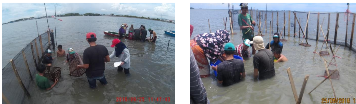
Gambar 3. Aktivitas penanaman lamun dengan metode kurungan